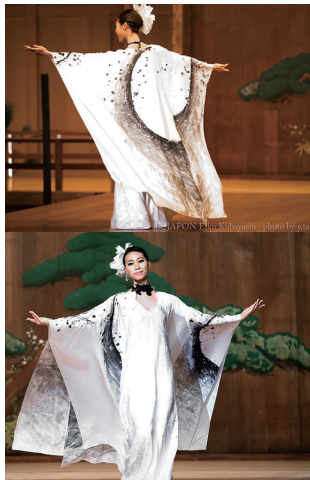
能舞「羽衣 -はごろも-」衣装とタイトル筆文字デザイン (2017年9月23日 横浜公演)